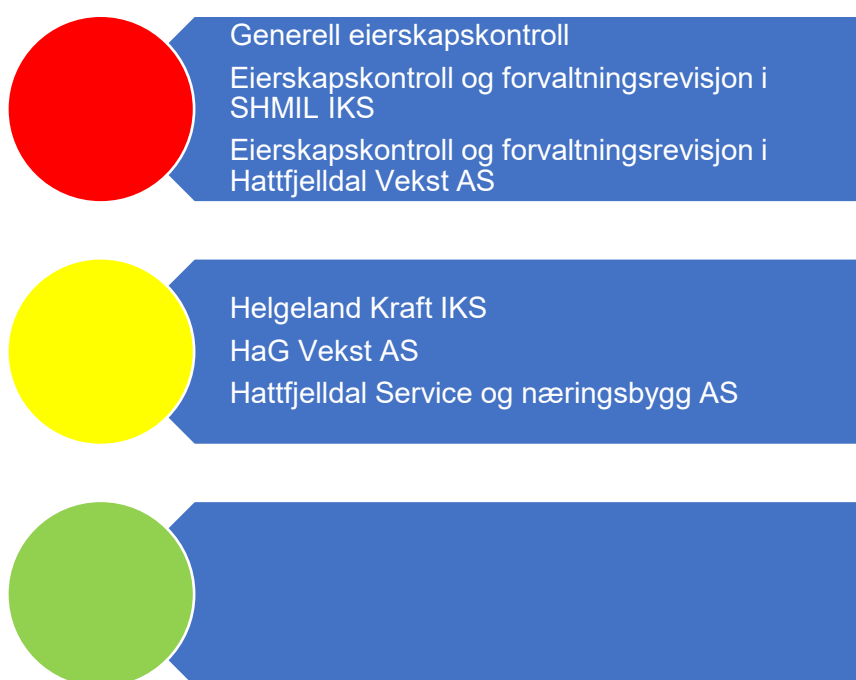
Figur 8. Risikovurdering eierskap

I figur 7 er risikovurderingene knyttet til kommune sine eierinteresser oppsummert og grunnlaget for vurderingene er nærmere vurdert i fortsettelsen.