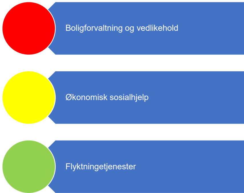
Figur 5. Risikovurdering velferd