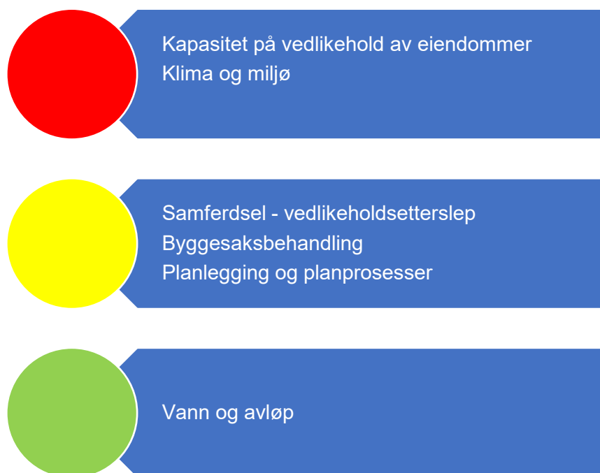
Figur 7. Risikovurdering teknisk

Figur 7 oppsummer risikovurderingene innenfor teknisk drift. Under følger en nærmere beskrivelse av data som er grunnlag for vurderingen.