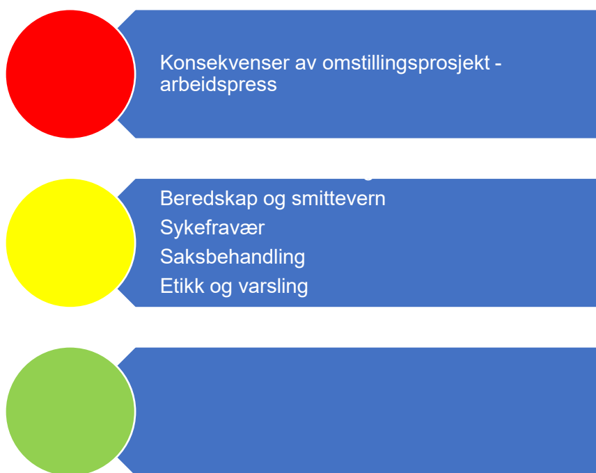
Figur 3. Risikovurdering organisasjon

Hattfjelldal har vært gjennom en stor omstilling i organisasjonen, som resulterte i at 11 årsverk ble tatt bort. Kommunen har redusert fastlønnsbudsjettet med ca. 6 millioner kroner går det fram av Årsmeldingen for 2018. Dette har hatt sin pris. Det er stor slitasje i organisasjonen, ifølge rådmannens kommentar i årsmeldingen. Forventningene fra innbyggere og politikere til tjenesteproduksjon er på samme nivå som tidligere. I administrasjonen er det kuttet ut 4 årsverk siden 2017, i tillegg til at det har vært vakanser i stillinger.