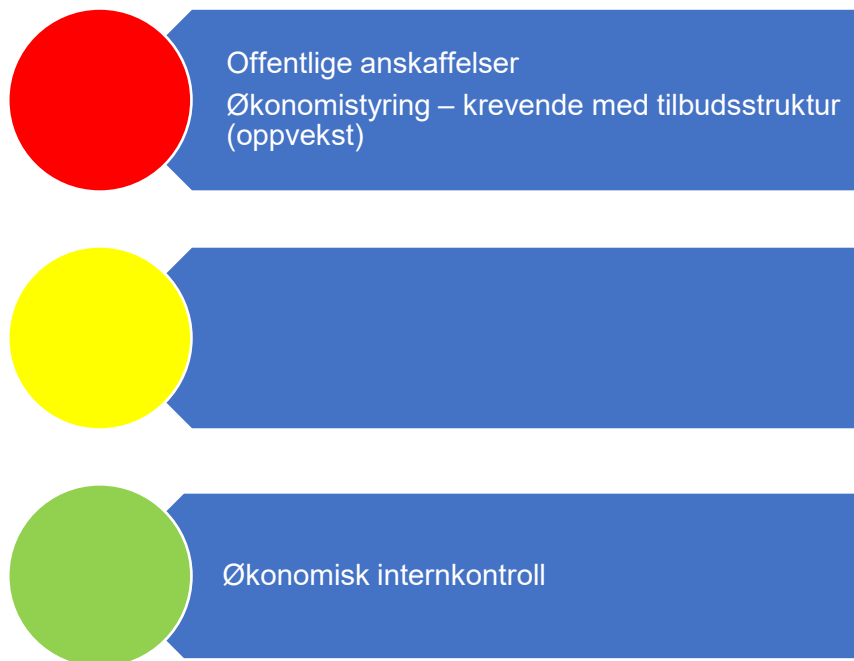
Figur 2. Risikovurdering økonomi

Figur 1 er en oppsummering av risikovurderingene som er gjort relatert til økonomi og i fortsettelsene presenteres bakgrunnen for vurderingene.